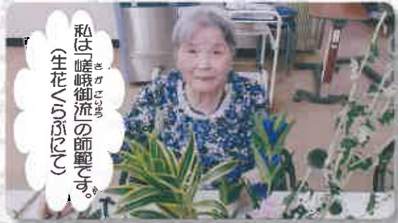
私は「嵯峨御流」の師範です。 (生花くわいびん)