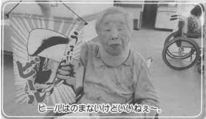
ビールはのまないけどいいねえ～。