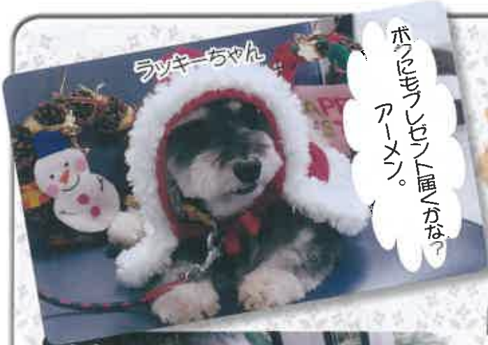
ボクにもフレンチブルドッグがなっ アーメン。