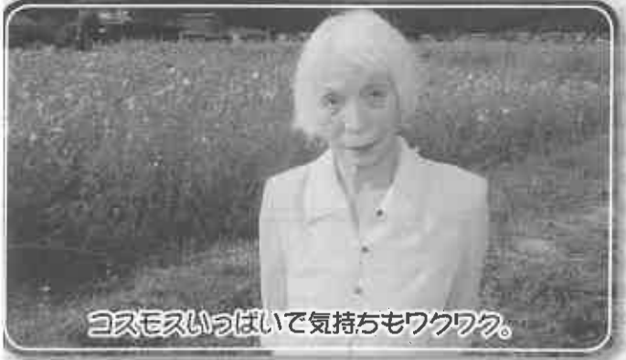
コスモスいっぱい気持ちもワクワク。