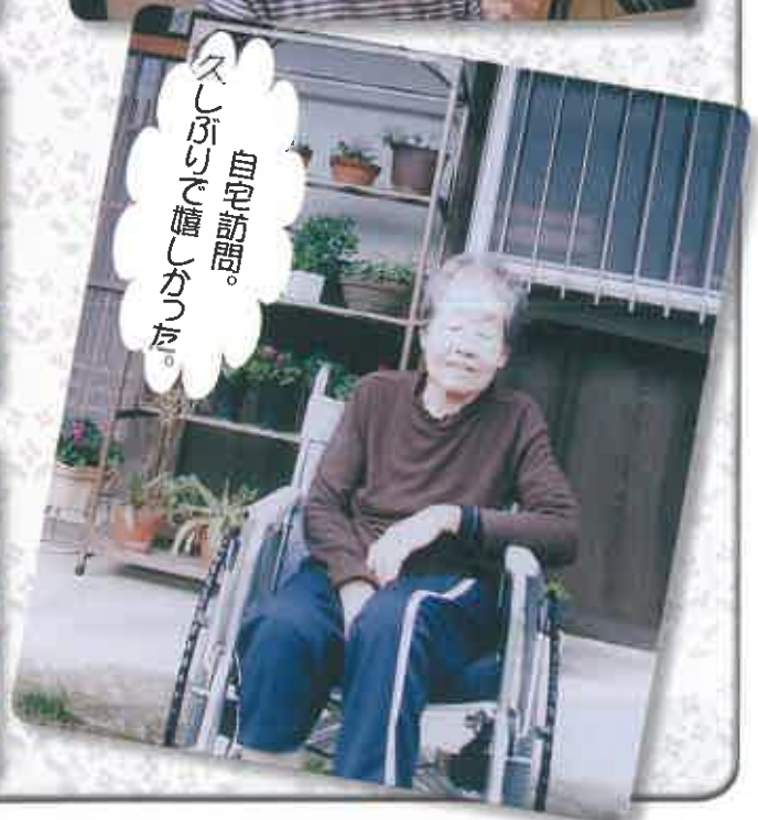
自宅訪問。 久しぶりで懐しかった。