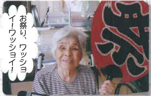
お祭り、ワッショ イ！ワッショイ！