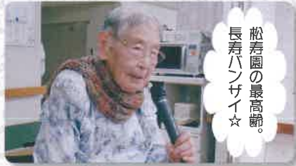
松寿園の最高齢。 長寿ハンサイ☆