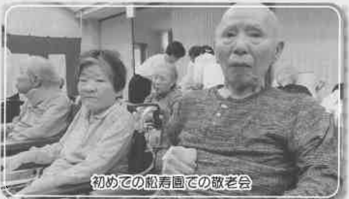
初めての松寿園での敬老会