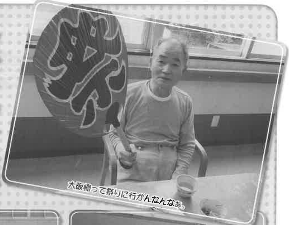
大阪帰って祭りに行かんなんなあ。