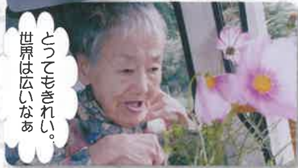
とつてもきれいな 世界は広いなあ