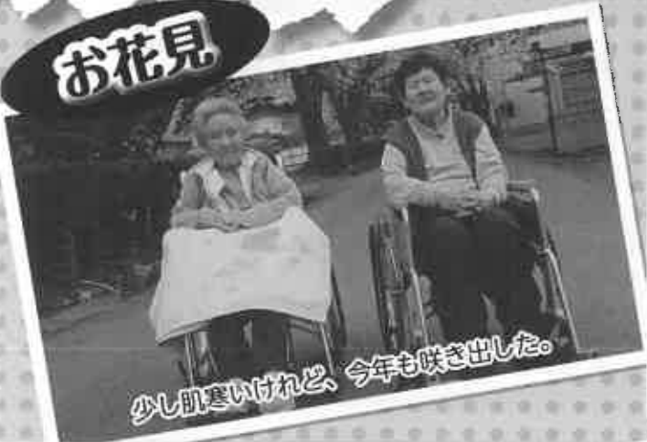
少し肌寒いけれど、今年も咲き出した。