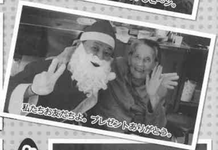
私たちお友だちよ。プレゼントありがとう。