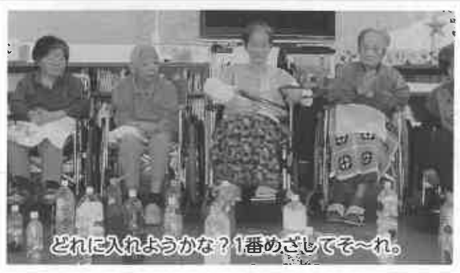
どれに入れようかな？1番めざしてそ〜れ。