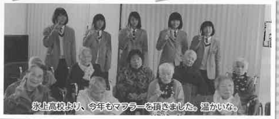
氷上高校より、今年もマフラーを頂きました。温かいな。