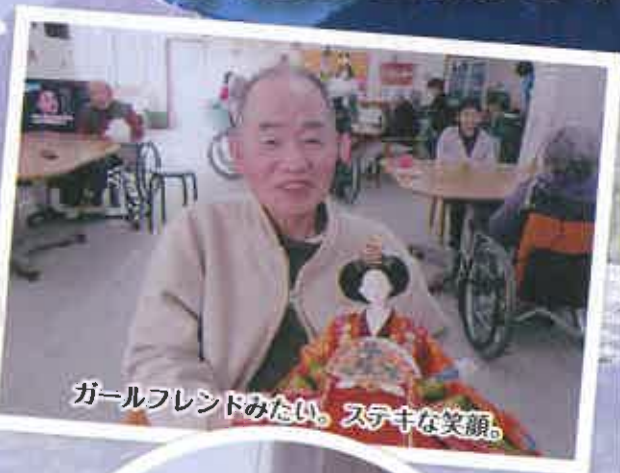
ガールフレンドみたい。ステキな笑顔。