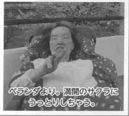
ベランダより。満開のサクラにうっとりしちゃう。