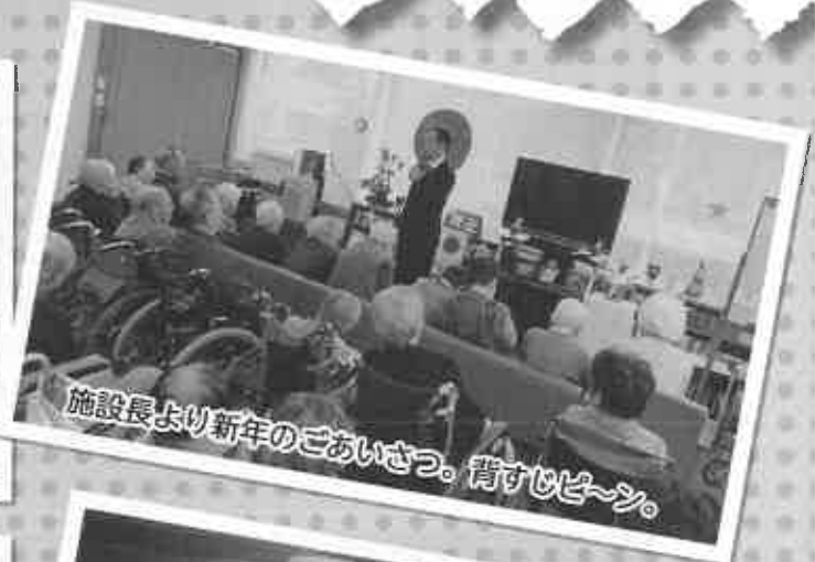
施設長より新年のごあいさつ。背すじピーン。