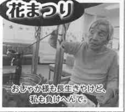
おしゃか様も長生きやけど、私も負けへんで。