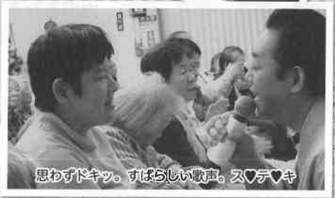
思わずドキッ。素晴らしい歌声。ス♡テ♡キ