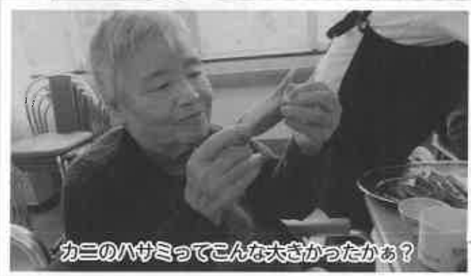
カニのハサミってこんな大きかったかあ？