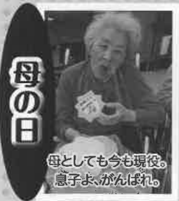
母としても今も現役。 息子よ、がんばれ。