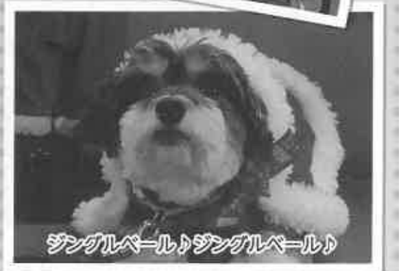
ジンガルパール♪ジンガルパール♪