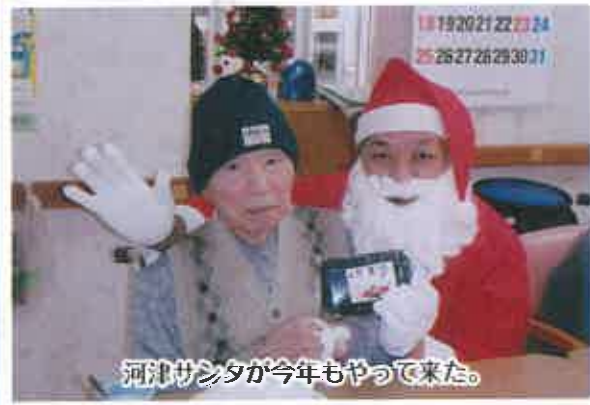
河津サンタが今年もやって来た。