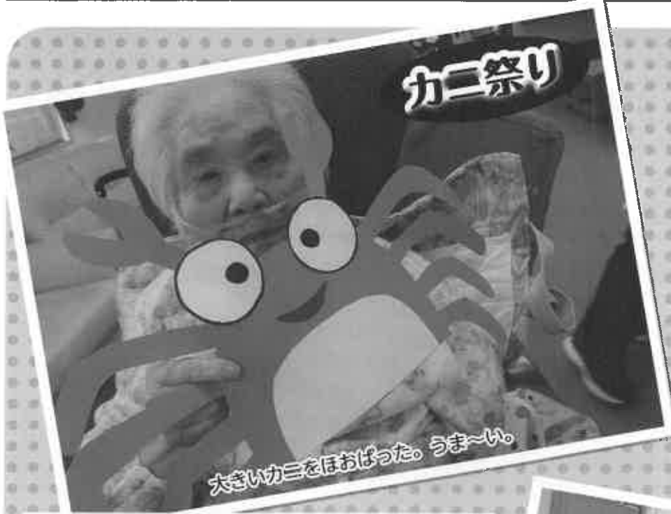
大きいカニをほおぼった。うま〜い。