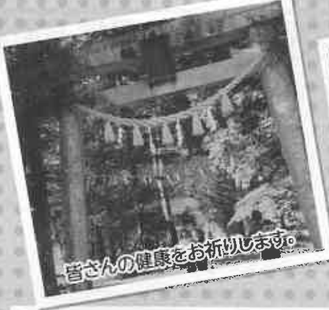
皆さんの健康をお祈りします。