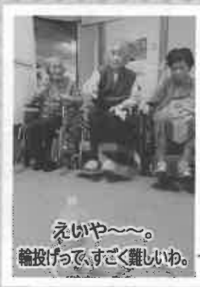
えいや〜。 輪投げって、すごく難しいわ。