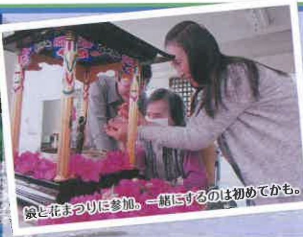
娘と花まつりに参加。一緒にするのは初めてかも。