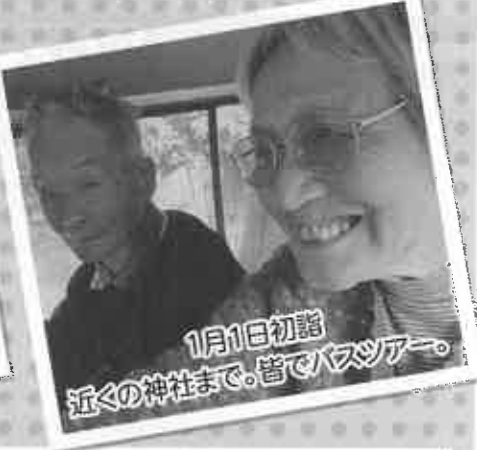
1月1日初詣 近くの神社まで。皆でバスツアー。