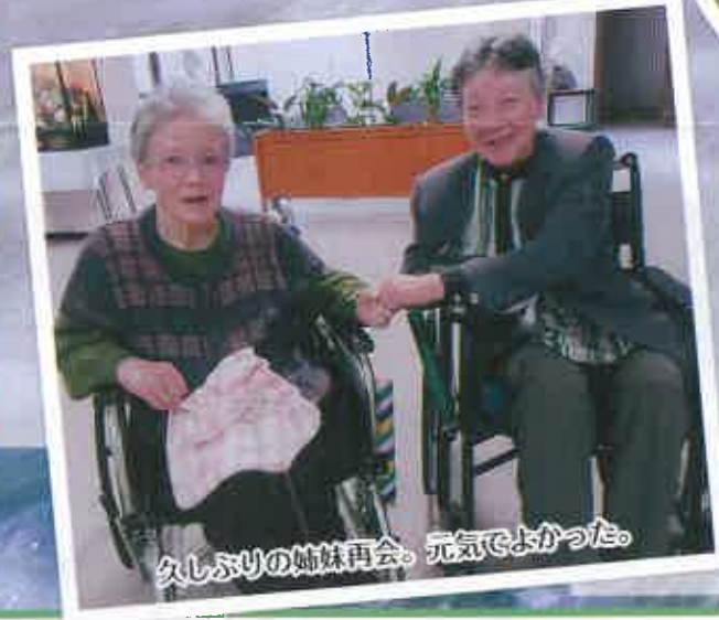
久しぶりの姉妹再会。元気でよかった。