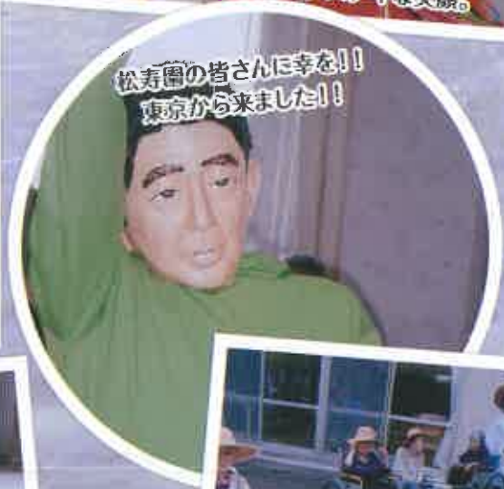
松寿園の皆さんに幸を!! 東京から来ました!!