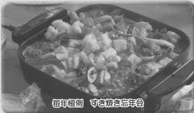
毎年恒例 すき焼き忘年会