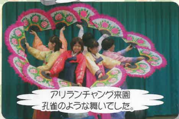
アリンチャンが来園 孔雀のような舞いでした。