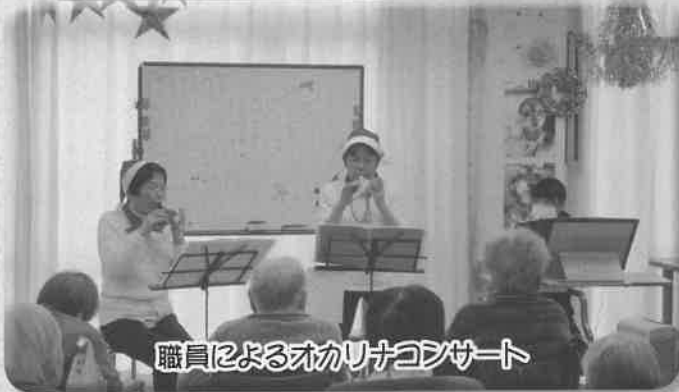
職員によるオカリナコンサート