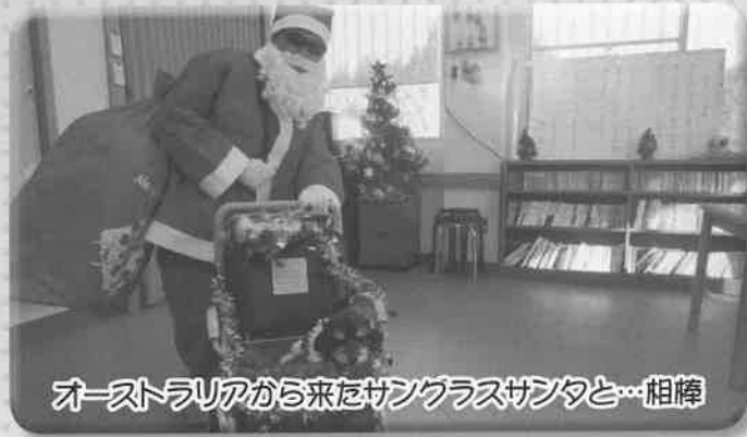
オーストラリアから来たサンクラスサンタと…相棒