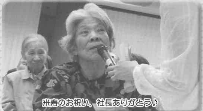
米寿のお祝い、社長ありがとう♪