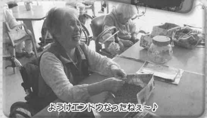
ようけエントウなつたねえ〜♪