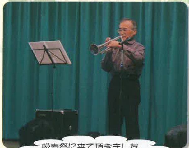
松寿祭に来て頂きました。 すばらしい音色で感激！