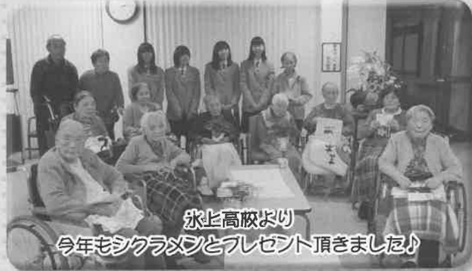
氷上高校より 今年もシクラメンとプレゼント頂きました♪