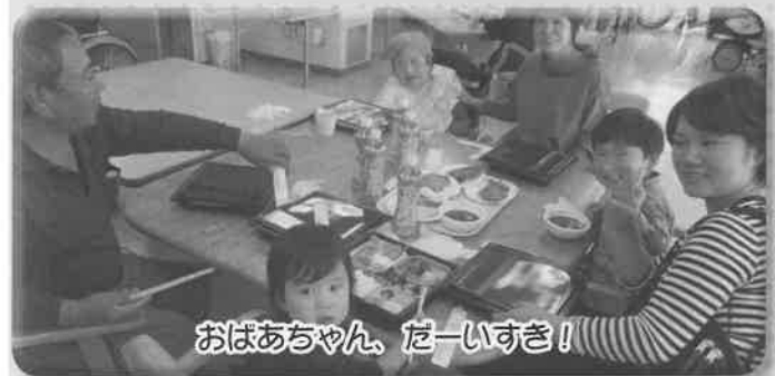
おばあちゃん、だーいすき！