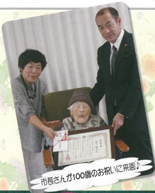
市長さんが100歳のお祝いに来園♪