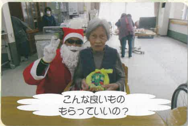
こんな良いもの もらっていいの？