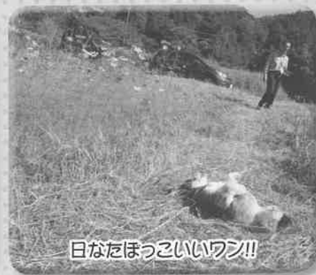
日なたほっこいいワン!!